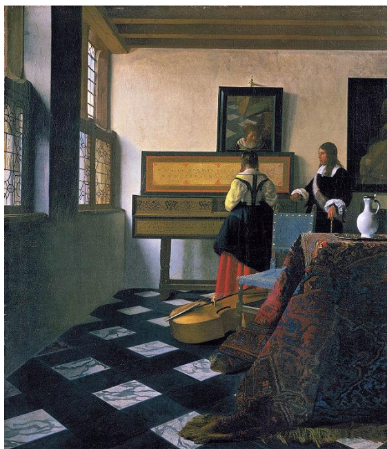
Jan Vermeer, Lekcja muzyki , ok.1659–64, Buckingham Palace.

Jaką rolę w życiu człowieka odgrywa muzyka? Omów zagadnienie, odwołując się do obrazu Jana Vermeera Lekcja muzyki oraz wybranych tekstów kultury.