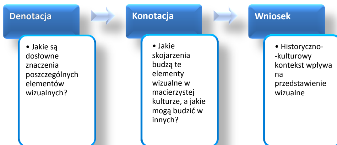
Rys. 1. Schemat zależności denotacji i konotacji (opracowanie własne)

Związek znaku i znaczenia nie zawsze jest precyzyjnie określony. W systemie denotacyjnym odnosi się do znaczenia dosłownego, wspólnego w danej kulturze. Ale w systemach konotacyjnych użytkownicy znaków na podstawie własnych skojarzeń odnoszą się do sekwencji znaków (syntagm), innych kodów i szerszych kontekstów kulturowych. Mapy znaczeń okazują się tylko skojarzeniami, uwarunkowanymi kulturą i potwierdzonymi przez osobnicze spostrzeżenia (por. rysunek 1).