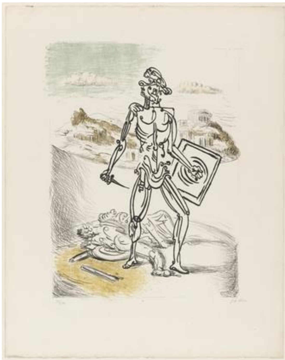
Ilustracja 3. Giorgio de Chirico Gladiator