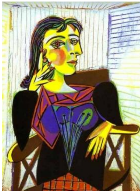
Pablo Picasso, Portret Dory Maar

http://pl.wikipedia.org/wiki/Portret_młodej_Flory_Rembrandt_Harmensz_van_Rijn_086.jpg