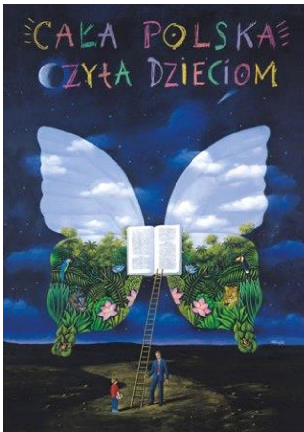
Rafał Olbiński, plakat [„Cała Polska czyta dzieciom”]

( http://www.um.poniatowa.pl/asp/en_start.asp?typ=13&sub=34&menu=35&artykul=1302&akcja=artykul ; dostęp 24.04.2015 r.)