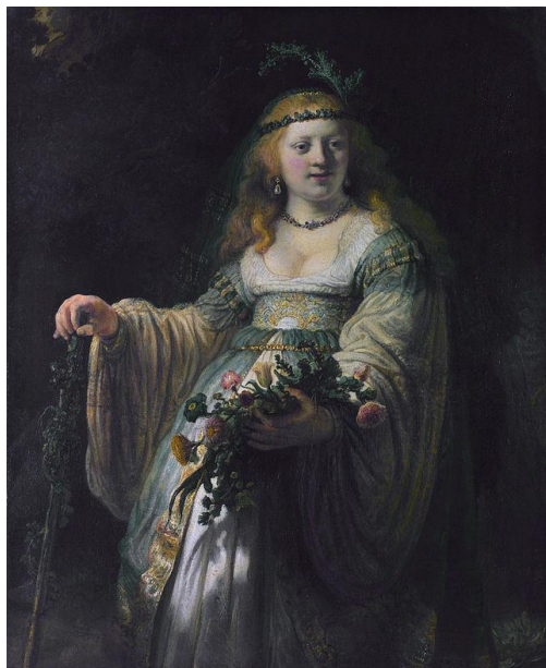
Rembrandt, Saskia jako Flora

http://pl.wikipedia.org/wiki/Portret_młodej_Flory_Rembrandt_Harmensz_van_Rijn_086.jpg