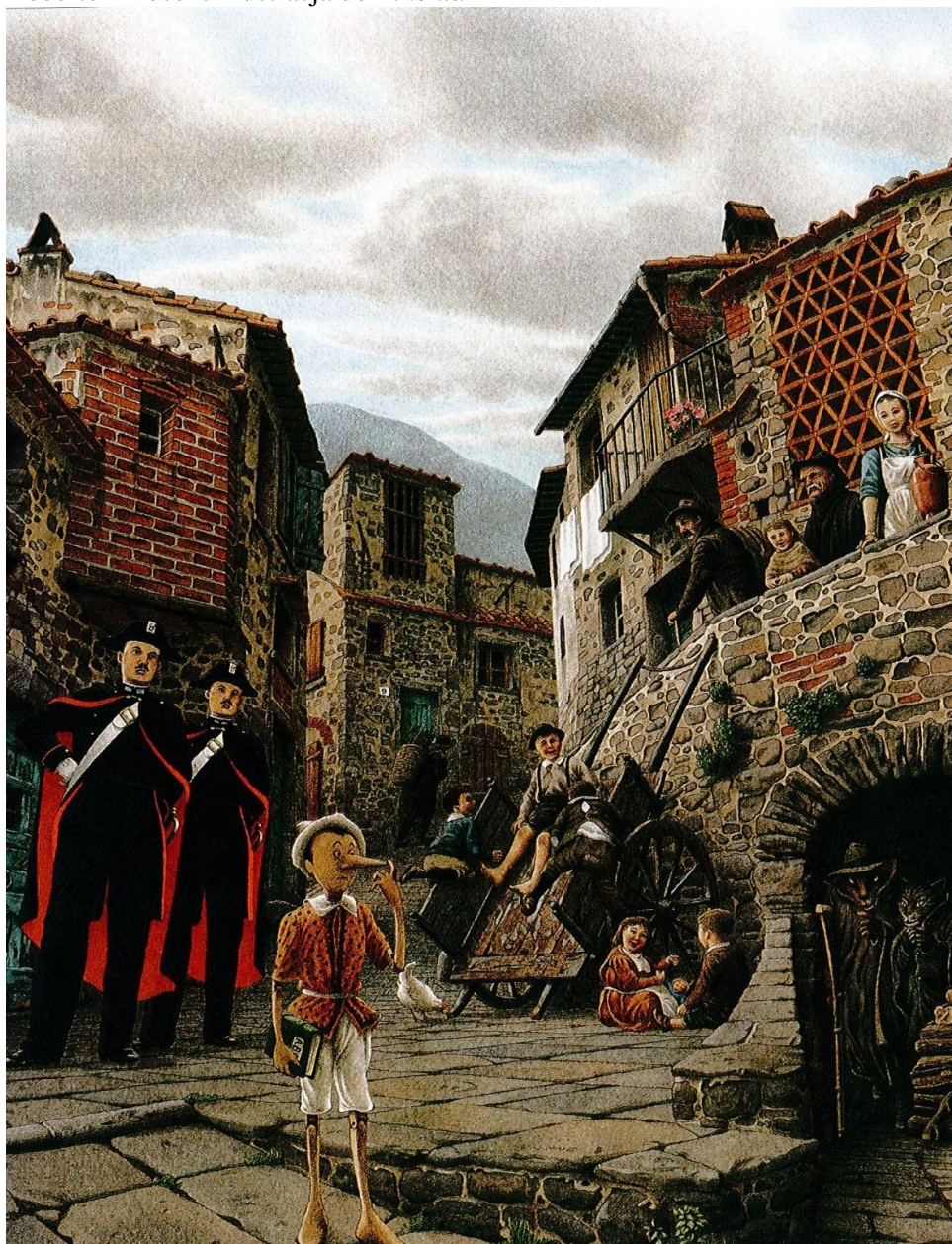
Roberto Innocenti, ilustracja do Pinokia , [w:] Carlo Collodoni Pinokio , Poznań 2005 r.