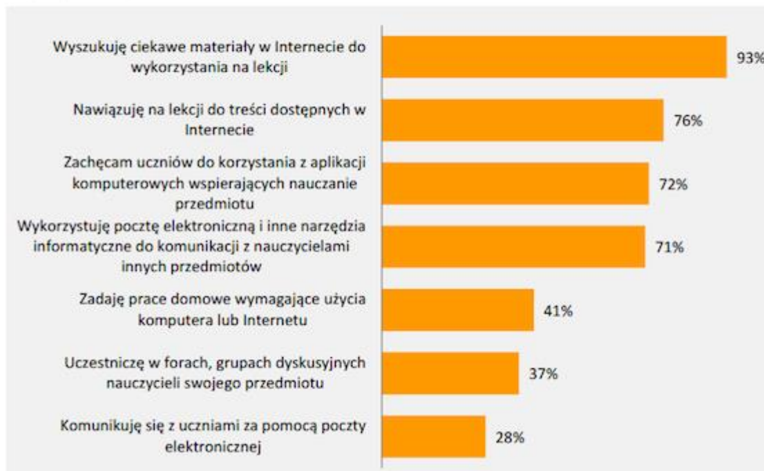
Wykres 3.29. Wykorzystanie nowych technologii w pracy nauczyciela co najmniej raz na miesiąc lub częściej (n=4762).

Badania Czasu Pracy Nauczycieli