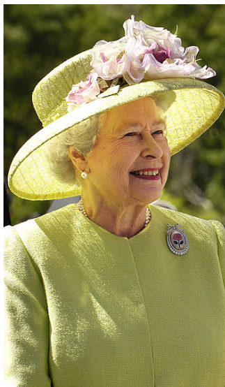
WIELKA BRYTANIA Królowa Elżbieta II