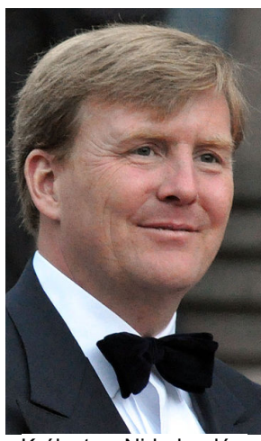
Królestwo Niderlandów (HOLANDIA) Wilhelm Aleksander