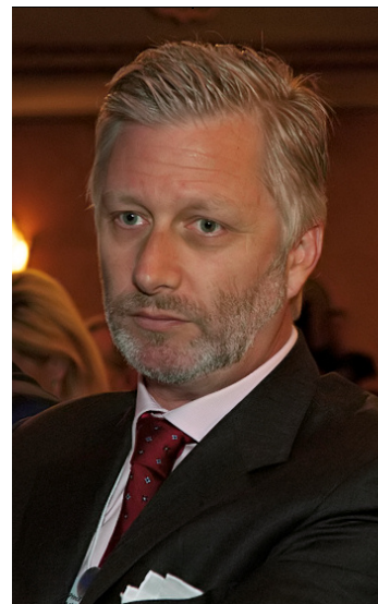
BELGIA Król Filip I Koburg