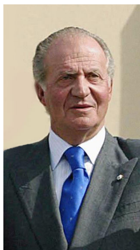
HISZPANIA Jan Karol I