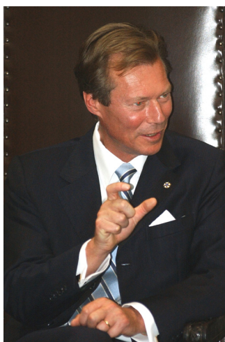
LUKSEMBURG Książę Henryk