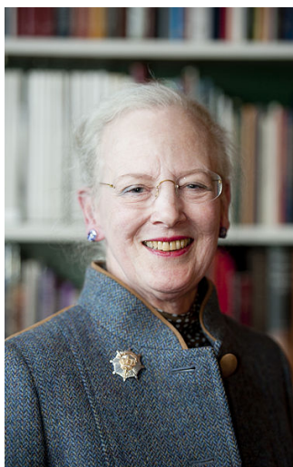
DANIA Królowa Małgorzata II