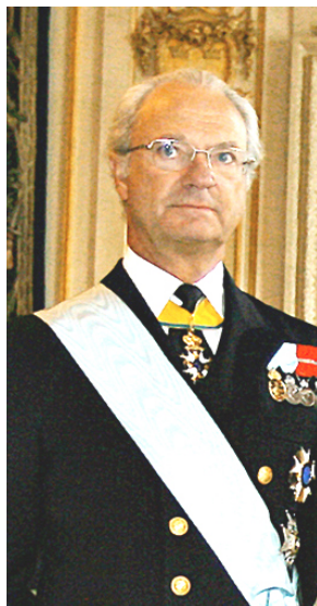
SZWECJA Karol XVI Gustaw