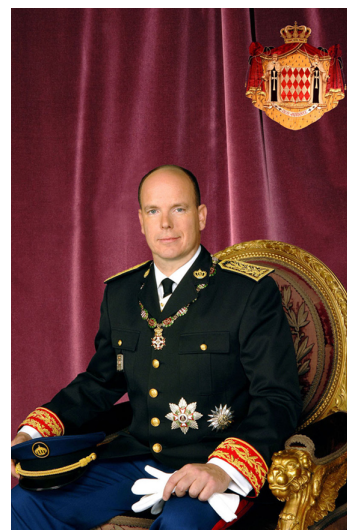
MONACO Albert II Grimaldi